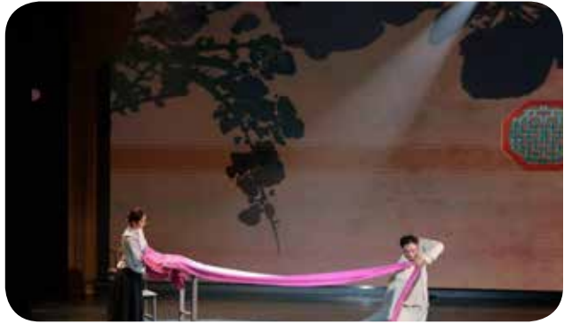
戏曲舞剧《一缕梅香》