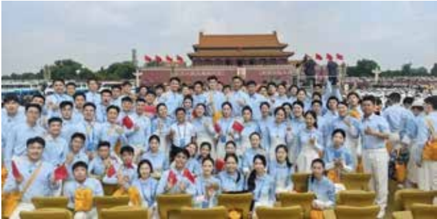
2025年9月，学校师生参加纪念中国人民抗日战争暨世界反法西斯战争胜利80周年大会广场合唱

2025年9月3日，在纪念中国人民抗日战争暨世界反法西斯战争胜利80周年大会开始前，由首都40所高校3000人组成的广场合唱团，在天安门广场上激情唱响一首首诞生于抗战烽火中的经典歌曲。