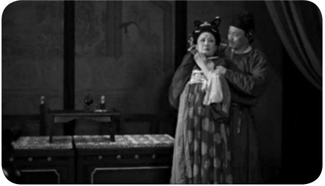
戏曲电影《荆十三娘》