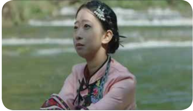
黔剧微电影《那夸那夸》