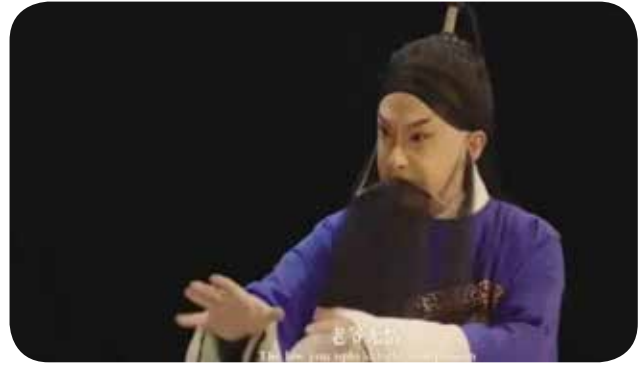
京剧电影《万水天上来》