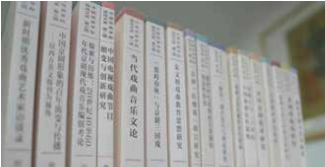
国戏文库系列丛书

“戏剧与小说、电影、文学的区别在于其‘戏剧性’。”“情境理论既是创作的重要环节，也是理论研究的重要方法。”“要在‘坚守戏曲本体’和‘校准数字理性’下功夫，实现具有产业价值的戏曲IP创新和创作人才孵化。”2025年1月，在学校举办的首期国戏青年教师学术沙龙上，青年骨干教师、研究生代表围绕谭露生著作《论戏剧性》展开探讨。国戏青年教师学术沙龙是学校促进青年教师学术成长的交流平台之一，旨在强化不同学科的交流融合，助推青年学者骨干成长，来自不同教学系和职能部门的教师打破专业壁垒，加强交流互鉴，强化理论思维，提升科研水平。