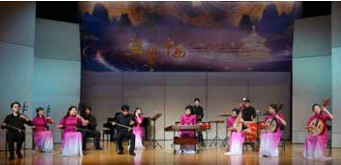
民乐室内乐《弹板》作曲：马骏 演奏：中国戏曲学院戏乐组合 民乐室内乐《拉洋车》作曲：邢骁 演奏：中国戏曲学院戏乐组合