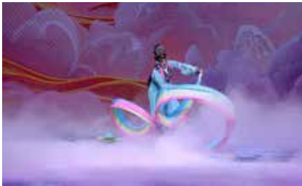
京剧《天女散花》片段 表演者：纽约州立宾汉顿大学教师 白珂（美国）