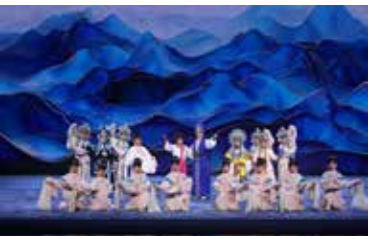
多剧种联唱《潮润琼韵·狮城文响》 演出单位：新加坡传统艺术中心 中国戏曲学院 指导教师：李艳华 杨朔 蔡东雄