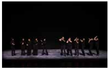
戏剧《走向五十》片段 演出单位：鲁布卡恩剧院和表演艺术中心