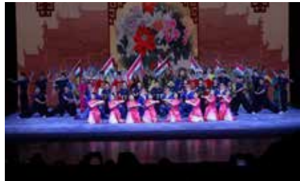
戏曲多剧种联唱集锦《梨园新蕊》 演出单位：中国戏曲学院 指导教师：尹秋艳 杨朔 杨洋 李艳华 林永娜 董超