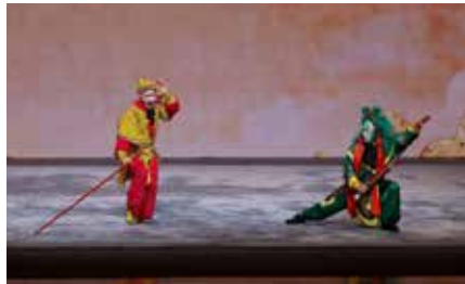
京剧《大闹天宫》片段 表演者：戏剧演员 格法（美国） 中国戏曲学院学生 孟黎 等 指导教师：孙亮 耿连军 张薇