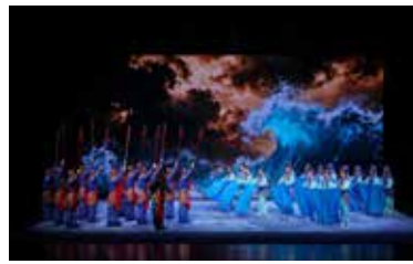
京剧《白蛇传·水斗》 演出单位：中国戏曲学院 指导教师：孙亮 耿连军 张薇