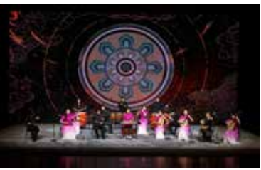
院东道情《弹板》 演出单位：新加坡艺术大学南洋艺术学院 中国戏曲学院 指导教师：牛长虹 马骏 黄晨达