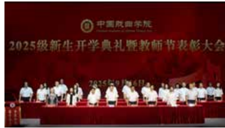
开学典礼在庄严的国歌声中拉开帷幕

9月16日，中国戏曲学院2025级新生开学典礼暨教师节表彰大会在大剧场隆重举行。