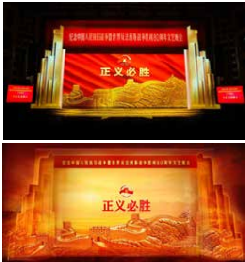
上：灯光效果图 下：剧照