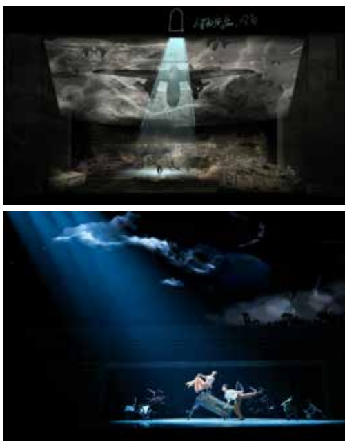
上：灯光效果图 下：剧照

以长32米巨型长城浮雕幕为精神图腾，搭配分层照明方案，打造“流动历史画卷”，构建“前—中—后”三维舞台空间，适配多元表演，让每处