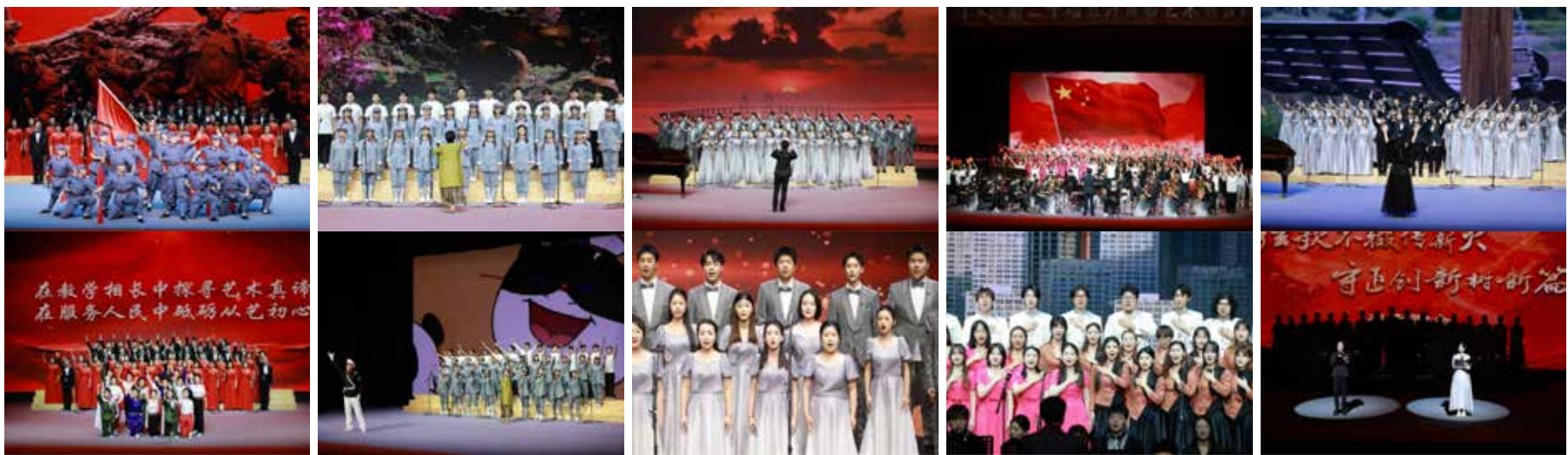
京昆系《我们在大路上》（七律·长征） 表演系《映山红》《黑猫警长》 导演系《不忘初心》《光荣与梦想》 音乐系《如愿》《村口同心》 戏曲文学系《灯火里的中国》《明天会更好》