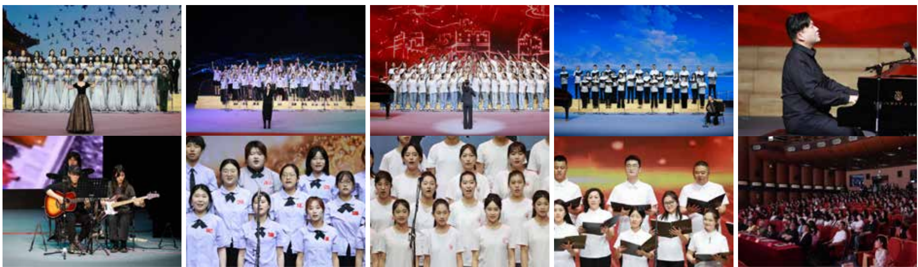
舞台美术系《祖国不会忘记》《我和我的祖国》 艺术管理与文化交流系《我们都是追梦人》《我乘着风飞过来》 附中《万疆》《长城谣》 教职工合唱团《不忘初心》《金梭银梭》