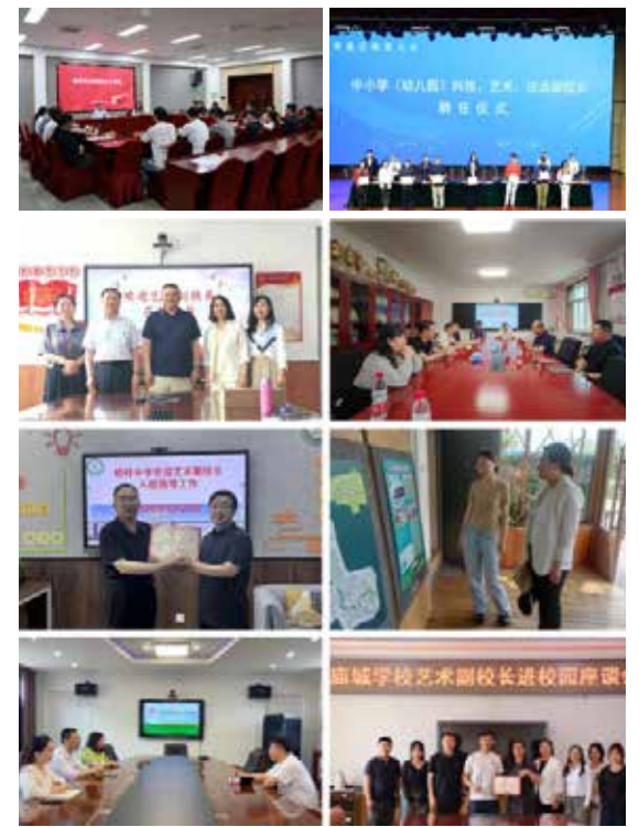
文：人事处

我校将携手怀柔区，围绕构建“戏曲+教育+科技+文旅”融合发展模式，在戏曲普及、思政育人、创作实践、实就业、文旅融合、品牌建设、交流开放等方面深化合作，通过建设师生实践创作基地、艺术采风基地、创业孵化基地，实施“乡村戏曲彩绘”等系列活动，努力打造首都高校服务地区发展的样板。